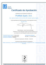
ISO 9001:2015 Sistema de gestão de qualidade