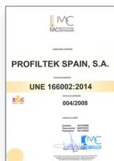
UNE 166002:2014 Gestão de I+D+i