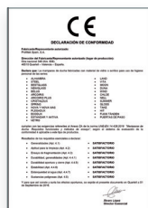
UNE-EN 14428:2016 Mamparas de baño