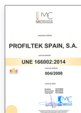
UNE 166002:2014 Gestão de I+D+i