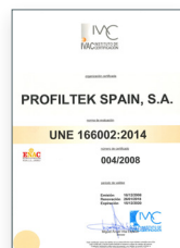
UNE 166002:2014 Gestão de I+D+i