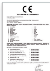
UNE-EN 14428:2016 Divisórias de banho