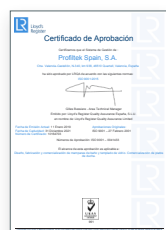
ISO 9001:2015 Sistema de gestão de qualidade