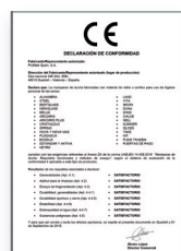
UNE-EN 14428:2016 Divisórias de banho