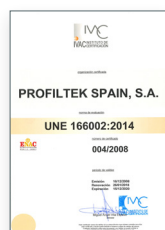
UNE 166002:2014 Gestão de I+D+i