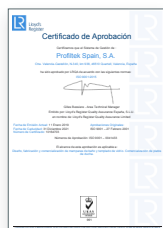
ISO 9001:2015 Sistema de gestão da qualidade