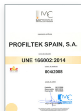
UNE 166002:2014 Gestão de I+D+i