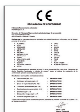
UNE-EN 14428:2016 Divisórias de banho