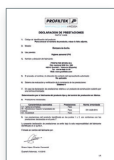
UNE-EN 14428:2016 Divisórias de banho