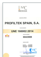
UNE 166002:2014 Gestão de I+D+i