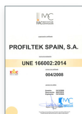
UNE 166002:2014 Gestão de I+D+i