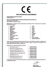
UNE-EN 14428:2016 Divisórias de banho