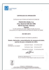
ISO 9001:2015 Sistema de gestão da qualidade