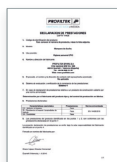
UNE-EN 14428:2016 Divisórias de banho