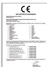
UNE-EN 14428:2016 Parois de bain