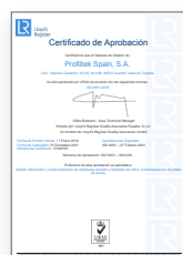
ISO 9001:2015 Système de gestion de la qualité