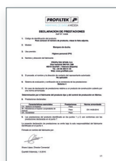
UNE-EN 14428:2016 Parois de bain