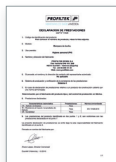
UNE-EN 14428:2016 Parois de bain