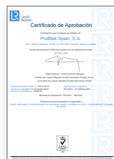
ISO 9001:2015 Système de gestion de la qualité