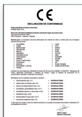
UNE-EN 14428:2016 Parois de bain