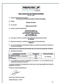
UNE-EN 14428:2016 Parois de bain