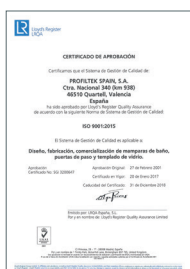
ISO 9001:2015 Système de gestion de la qualité