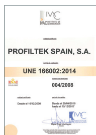
UNE 166002:2014 Gestion R+D+i