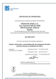
ISO 9001:2015 Système de gestion de la qualité