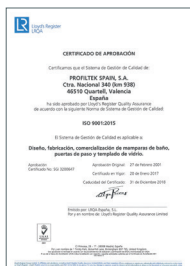
ISO 9001:2015 Système de gestion de la qualité