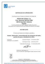
ISO 9001:2015 Système de gestion de la qualité