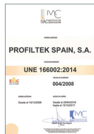
UNE 166002:2014 Gestion R+D+i