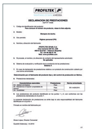
UNE-EN 14428:2016 Parois de bain