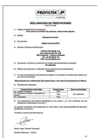
UNE-EN 14428:2016 Parois de bain