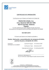
ISO 9001:2015 Système de gestion de la qualité