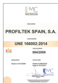
UNE 166002:2014 Gestion R+D+i