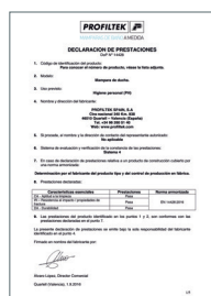
UNE-EN 14428:2016 Parois de bain