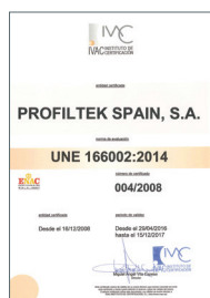
UNE 166002:2014 Gestion R+D+i