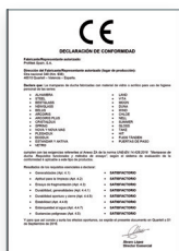
UNE-EN 14428:2016 Mamparas de baño