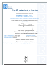
ISO 9001:2015 Sistema de gestión de la calidad