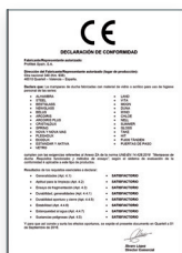
UNE-EN 14428:2016 Mamparas de baño