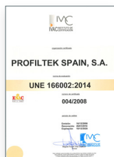
UNE 166002:2014 Gestión de I+D+i