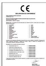
UNE-EN 14428:2016 Mamparas de baño