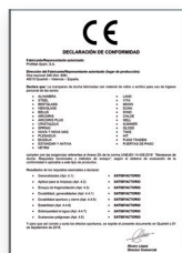
UNE-EN 14428:2016 Mamparas de baño