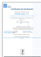
ISO 9001:2015 Sistema de gestión de la calidad