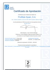
ISO 9001:2015 Sistema de gestión de la calidad