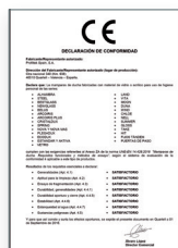
UNE-EN 14428:2016 Mamparas de baño