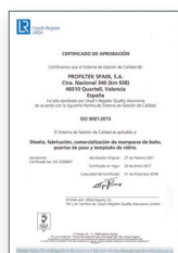
ISO 9001:2015 Sistema de gestión de la calidad