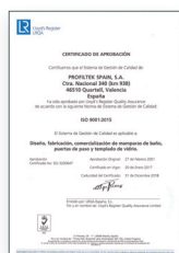
ISO 9001:2015 Sistema de gestión de la calidad