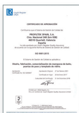
ISO 9001:2015 Sistema de gestión de la calidad