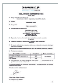
UNE-EN 14428:2016 Mamparas de baño