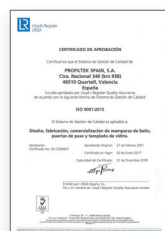
ISO 9001:2015 Sistema de gestión de la calidad