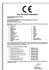
UNE-EN 14428:2016 Mamparas de baño