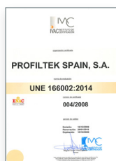
UNE 166002:2014 Gestión de I+D+i