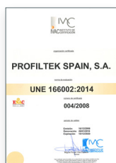
UNE 166002:2014 Gestión de I+D+i