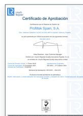
ISO 9001:2015 Sistema de gestión de la calidad