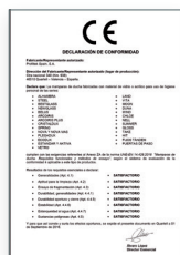
UNE-EN 14428:2016 Parois de bain