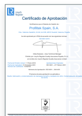
ISO 9001:2015 Système de gestion de la qualité