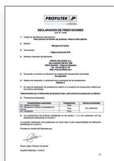
UNE-EN 14428:2016 Duschkabine